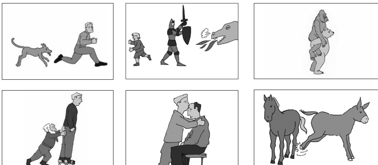
Abb. 2: Wortschatzüberprüfung: Verben, Beispiel (abgebildete Verben: obere Reihe: jagen, retten, tragen; untere Reihe: schieben, küssen, treten).