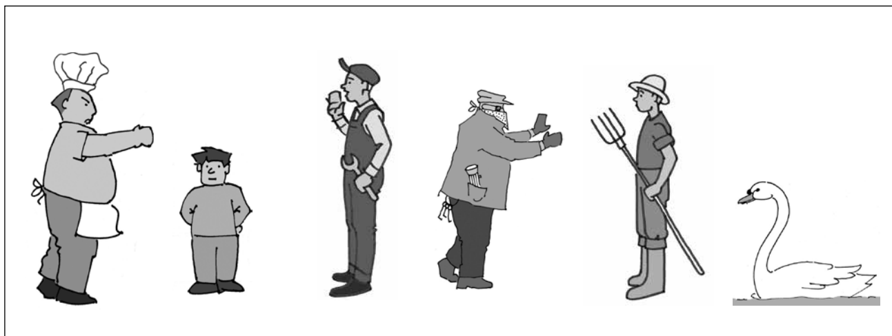
Abb. 1: Wortschatzüberprüfung: Nomen, Beispiel (Koch, Junge, Handwerker, Dieb, Gärtner, Schwan)

Zu diesem Zweck werden jeweils sechs Abbildungen (Objekte oder Handlungen) auf einer von vier Bildseiten präsentiert (vgl. Abb. 1 und 2). Während der Durchführung werden die Bildseiten einzeln vor dem Kind aufgedeckt und der Untersucher spricht jeweils ein Wort vor. Die Testitems werden dabei vom Protokollbogen abgelesen. Das Kind ist aufgefordert, auf die entsprechende Abbildung zu zeigen. Eine kurze Durchführungsanweisung sowie die Instruktion sind auch auf den Protokollbögen jeweils vermerkt (für weitere Informationen s. Kap. 4).